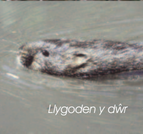
Llygoden y dŵr