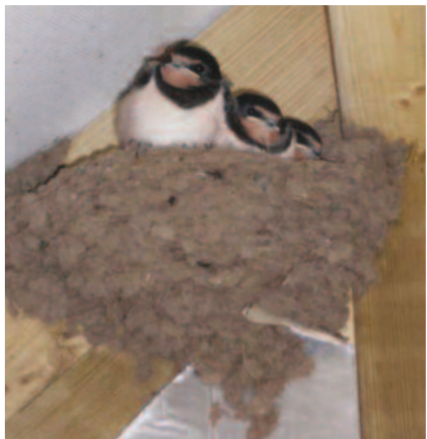
Nyth gwenoliaid

Mae rhai rhywogaethau adar fel gwenoliaid, gwenoliaid duon, gwenoliaid y bondo, adar y to, y dryw, y robin a'r dylluan wen yn aml yn nythu mewn adeiladau os yw'n bosibl iddynt wneud hynny. Mae rhywogaethau eraill fel bronwen y dŵr a'r siglen benllwyd yn defnyddio pontydd i nythu. Mae tymor nythu adar yn amrywio yn ôl y tywydd a rhywogaeth yr aderyn ond yn gyffredinol mae'r tymor nythu rhwng dechrau Mawrth a diwedd Awst (neu ddiwedd Medi yn achos rhywogaethau fel gwenoliaid).