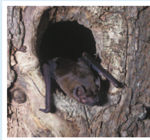
Ystum mawr mewn coeden