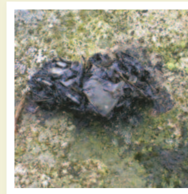
Baw dyfrgi yn dangos asgwrn pysgodyn

gofynnwch am gyngor (gweler tudalen 12).