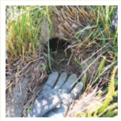
Twll llygoden y dŵr