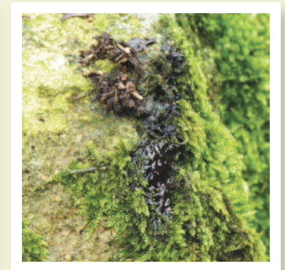
Gweddillion baw dyfrgi yn dangos ôl tar/olew