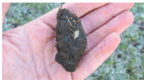
Pelen y dylluan