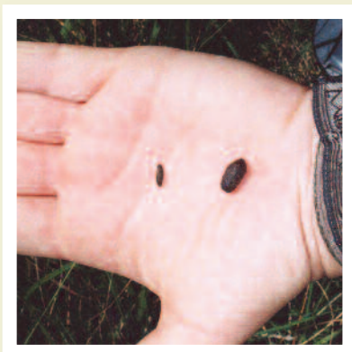
Baw llygoden y dŵr tua 8-12mm (ar y dde) o'i gymharu â baw llygoden goch sy'n llai (ar y chwith)