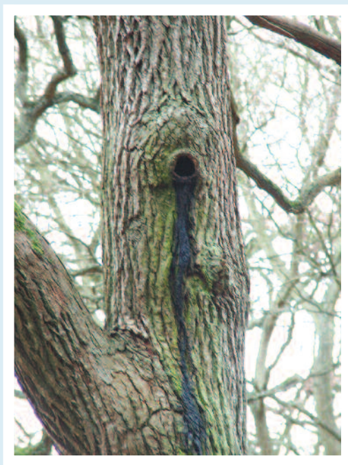
Staining below a bat roost