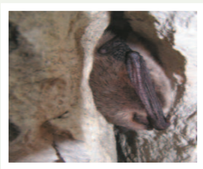
Ystum y dŵr yn clwydo

Gallwch ddod o hyd i ystumod mewn adeiladau, ar bontydd a strwythurau eraill. Yr enw a roddir ar unrhyw le y mae ystum yn byw yw clwydfan. Nid ydynt yn adeiladu clwydfannau fel y mae adar yn adeiladu nythod, ond maent yn defnyddio adeileddau sydd eisoes yn bodoli neu goed fel safleoedd clwydo. Mae rhai rhywogaethau ystumod yn crogi'n rhydd ond mae'r rhan fwyaf yn mynd i mewn i holltau neu graciau mor gul â 12mm o led. Gall ail-bwyntio a gwtio frifo neu gladdu ystumod. Gall hyd yn oed peintio a thrin pren effeithio ar ystumod os ydyn nhw'n clwydo gerllaw.