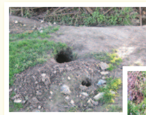
Daeare moch daear

Gwarchod: Gwarchodir moch daear a'u daear gan y gyfraith 6 . Gall gwaith o fewn 30m o ddaear fod yn anghyfreithlon heb drwydded.