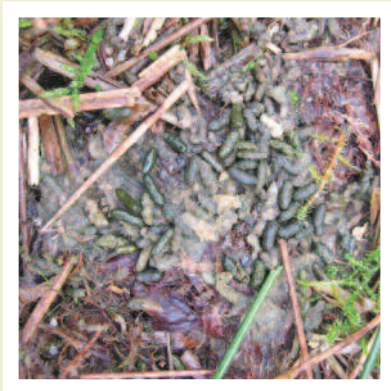
Carthfa llygoden y dŵr