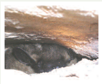
Ystum adain-lydan yn clwydo