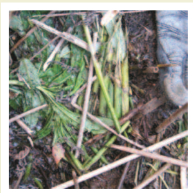
Ôl llygoden y dŵr sydd wedi bod yn bwydo