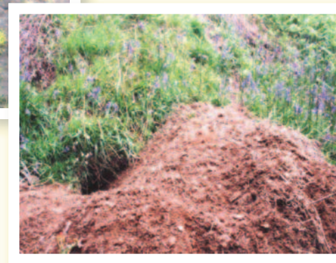
Daeare moch daear