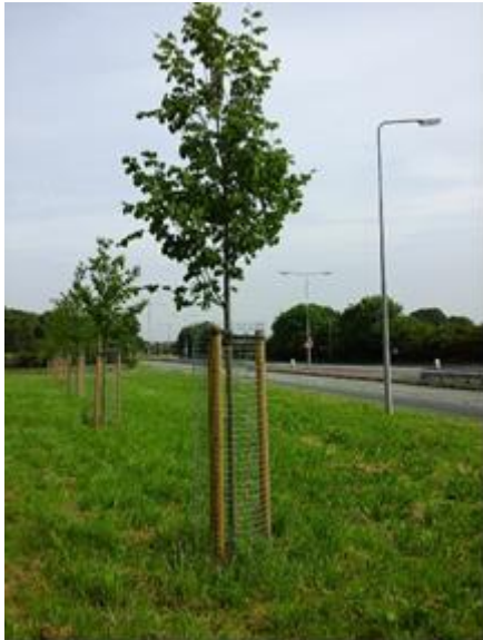
Llun 5. Plannu ar ymyl ffordd meddal