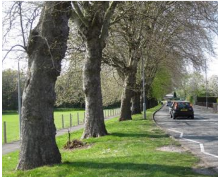
Llun 6. Coed llawn-dwf ar ochr y briffordd yn y Fflint

Mae plannu yn y pafin ar strydoedd yn dechnegol heriol ac mae angen ymgynghori gyda nifer o fudd-ddeiliaid (e.e. peirianwyr priffyrdd, darparwyr cyfleustodau, gweithwyr tirlunio a gweithwyr coed). Rhaid i waith plannu fodloni safonau priffyrdd a chreu amodau addas i goed dyfu. Er hynny, gall plannu coed ar strydoedd fod yn effeithiol iawn i wella ansawdd y parth cyhoeddus. Oherwydd ei fod yn eithaf costus, mae gwaith plannu mewn pafin fel arfer yn cael ei wneud yn rhan o gynlluniau adfywio sydd wedi'u hariannu'n allanol.