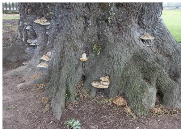
Llun 14. Gwaelod y dderwen hynafol yn Ysgol Bryn Gwalia