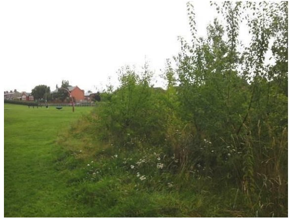
Llun 3. Coed ifanc a blannwyd yn The Willows, yr Hôb, wedi'i gategoreiddio fel man agored ffurfiol

I gynorthwyo â chreu gorchudd coed gwydn ac amrywiol, bydd rhywogaethau llai cyffredin o goed yn cael eu plannu. Bydd y rhywogaethau llai cyffredin hyn hefyd yn fwy diddorol ac ni fyddant yn edrych yn od mewn tirlun mwy ffurfiol. Mewn mannau agored ffurfiol, mae gorddibyniaeth ar goed ar eu llawn dwf a hen goed i ddarparu gorchudd a byddai plannu coed newydd yn arwain at goed o oed a maint mwy amrywiol.