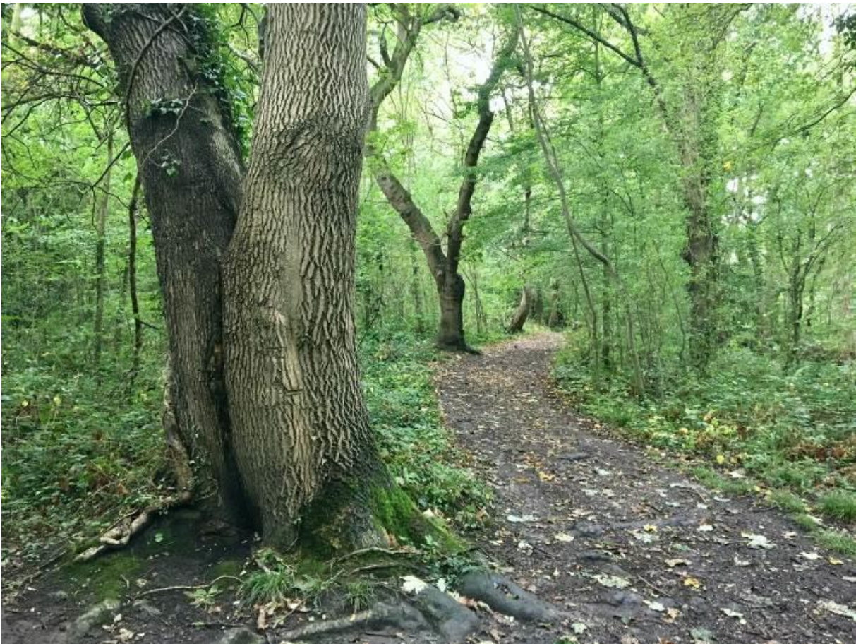
Llun 12. Coetir trefol ym Mharc Gwepre

Bydd y Cyngor yn gwarchod a gwella ei goetir trefol ei hun gydag arweiniad cynlluniau rheoli coetir hirdymor. Bydd cynlluniau rheoli'n seiliedig ar bolisi o orchudd parhaus fel bod gorchudd coed yn y tymor hir yn parhau'r un fath neu'n cael ei gynyddu. Ni fydd coed ond yn cael eu torri pan fo rhesymau diogelwch pwysicach na'u cadw, er mwyn hwyluso aildyfiant naturiol neu i blannu coed newydd. Pan ystyrir bod torri coed yn dderbyniol, ni fydd ond yn digwydd mewn darnau bach o goetir neu i deneuo coed. Mewn achosion eithriadol, efallai y bydd coed prysgwydd ifanc yn cael eu clirio i wella cymunedau planhigion penodol o brin (e.e. glaswelltir calchfaen), nodweddion daearegol (e.e. calchbalmant) neu henebion.