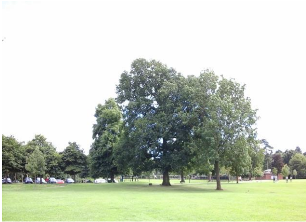
Llun 2. Coed llawn-dwf a thir parc ym Mharc Gwepira sydd wedi'i gategoreiddio fel man agored ffurfiol

I wella bioamrywiaeth, mae cyfle hefyd i hau blodau gwyllt ger y coed lle nad yw'r glaswellt yn cael ei dorri mor aml yn rhan o ddulliau rheoli mannau agored diwygiedig.