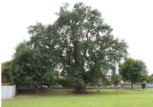
Llun 13. Derwen hynafol yn Ysgol Bryn Gwalia, yr Wyddgrug

Mae gan Ysgol Bryn Gwalia yn yr Wyddgrug dderwen goesynnog hynafol yn tyfu ar ei thir sy'n 8.3 metr o amgylch y bonyn, y fwyaf y gwyddom amdani yn Sir y Fflint. Y dderwen yw arwyddlun yr ysgol a'r amcangyfrif cywiraf o oedran y goeden gan ddefnyddio dull White 53 yw 774 oed. Er gwaethaf oedran y dderwen, mae'n rhyfeddol o unffurf a chryf ac oherwydd hynny nid oes nodweddion hen goeden arni.