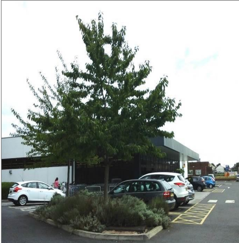
Llun 11. Nodweddion tirlunio mewn datblygiad manwerthu newydd, y Fflint

Polisi L1 yng Nghynllun Datblygu Unedol Sir y Fflint yw'r polisi sy'n cefnogi tirlunio ac mae'n nodi;