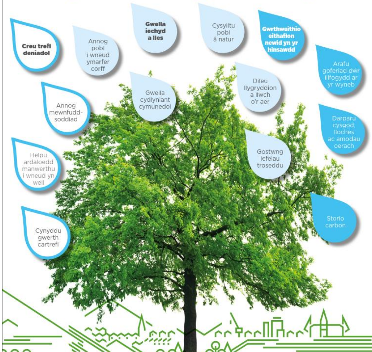
Ffigwr 1. Mae coed yn asedau naturiol grymus ac amlwrpas (CNC)

Mae'r ardaloedd sy'n cael eu heffeithio waethaf wedi'u lleoli ar hyd priffyrdd ac ardaloedd â diffyg isadeiledd gwyrdd. Mae'r dystiolaeth yn awgrymu bod coed trefol yn cael gwared â llawer o lygredd o'r aer a bod llai o blant yn dioddef o asthma lle mae coed ar y stryd.