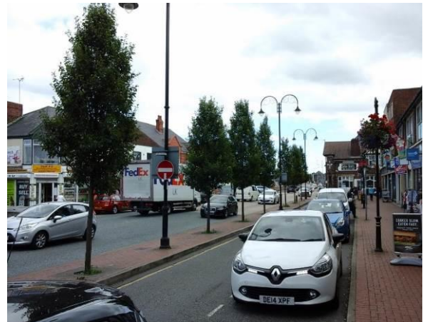
Llun 7 ac 8. Gwaith plannu ar stryd yn y Fflint a wnaed yn 2013 (cyn plannu, chwith, ac ar ôl plannu, dde)