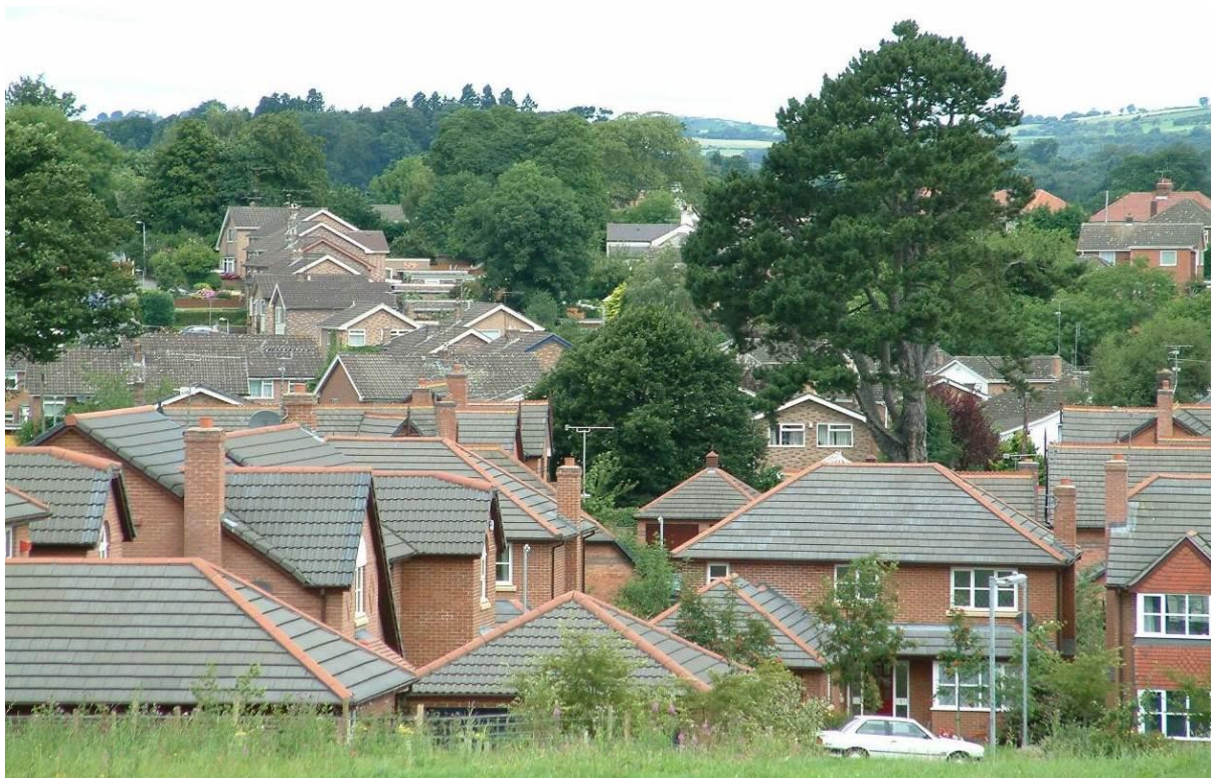
Llun 11. Gorchudd coed trefol yr Wyddgrug

Roedd y dull traddodiadol o reoli coed yn edrych ar goeden unigol a'r hyn roedd ei angen i ddatrys problem neu fater penodol. Nid oedd y dull traddodiadol yn strategol ac nid oedd y gorchudd coed yn cael ei fesur, felly roedd ansicrwydd a oedd yn gynaliadwy. Roedd dyfodiad mudiad coedwigaeth drefol yn cydnabod bod yr adnodd coedwig drefol cyfan yn llawer mwy na'r rhannau unigol gyda'i gilydd a'i fod yn adnodd i bawb sydd â gwerth ariannol. I reoli gorchudd coed trefol yn gynaliadwy, bydd angen i'r Cyngor fabwysiadu dull modern (Tabl 9).