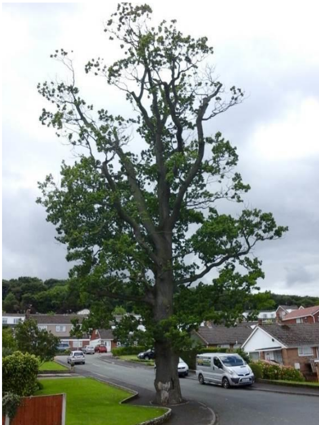
Llun 12. Derwen llawn-dwf yn dirywio sy'n cael ei harchwilio'n aml

Mae'r risg o farw neu gael anaf o ganlyniad i goeden yn disgyn yn aml yn cael ei chwyddo. Credir bod hyn oherwydd bod gormod o adroddiadau am achosion o'r fath yn y cyfryngau, a hynny, debyg, gan eu bod yn cael eu hystyried yn ddamweiniau anghyffredin ac yn deilwng o fod ar y newyddion 37 . Yn ôl yr ystadegau, mae'r risg o gael eich lladd gan goeden neu gangen sy'n disgyn sydd mewn ardal sy'n cael ei defnyddio gan y cyhoedd yn hynod o isel 38 .