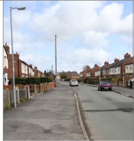
Llun 10. Park Avenue, Saltney