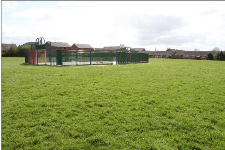
Llun 9. Cae chwarae Park Avenue, Saltney