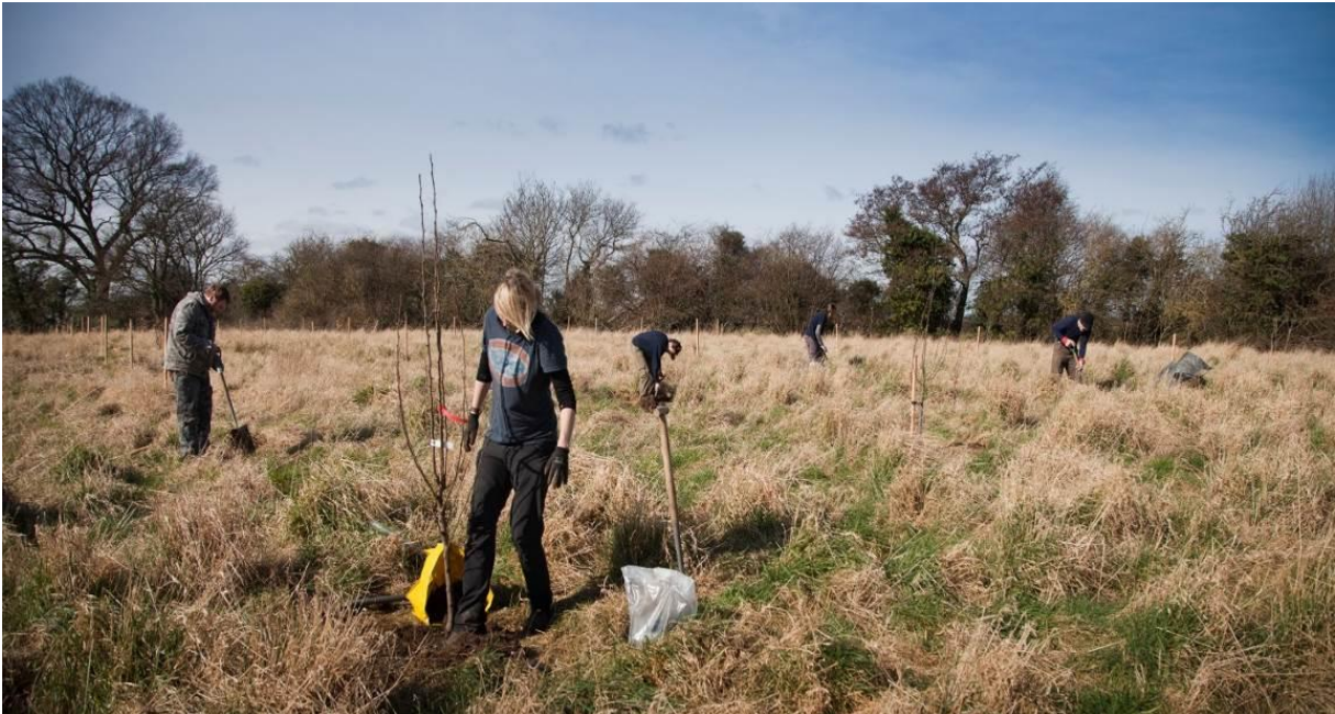
Llun 14. Gwirfoddolwyr yn plannu coed perllan yn Llwyni ar gyrion Cei Connah.

Bydd partneriaid i gyflawni'r cynllun yn cynnwys cyngorau tref a chymuned a gallai Coed Cadw hefyd fod yn bartneriaid. Mae'r Gwasanaeth Cefn Gwlad eisoes wedi creu partneriaethau gwaith da ac mae'n rheoli coetir yng Nghastell Caergwrle ar ran y cyngor cymuned.