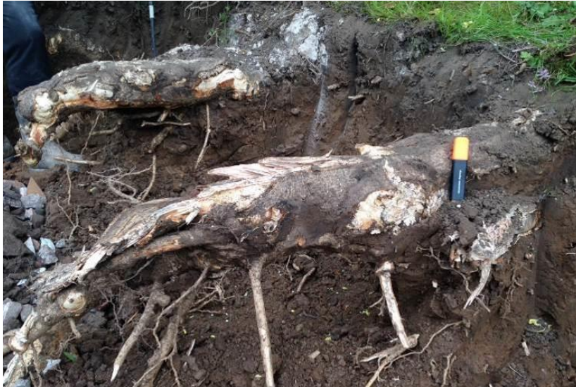
Llun 13. Gwreiddiau strwythurol a dorrwyd ychydig o dan yr wyneb wrth gloddio

Mae haen orchudd Sir y Fflint wedi'i gwneud o rewlai, tywod a gro gyda thywod llifwaddod a caenau gro ar achlysur mewn dyffrynnoedd. Oherwydd y ddaear hon, nid yw'r math o bridd sy'n gorwedd arni'n crebachu wrth sychu ac mae'r potensial am ymsuddiant yn gysylltiedig â gwreiddiau coed yn isel. Er hynny, os tybir bod ymsuddiant wedi'i achosi gan wreiddio coeden y Cyngor, dylai unrhyw hawliad a gyflwynir i'r Cyngor gael ei ategu gan wybodaeth dechnegol (adroddiad coedyddiaeth, adroddiad peiriannydd strwythurol a chyfnod o fonitro craciau). Pan mae prawf mai coeden oedd prif achos ymsuddiant, bydd camau adferol yn cael eu cymryd sy'n briodol i'r holl ffactorau perthnasol, gan gynnwys amwynder ac arfer orau coedyddiaeth.