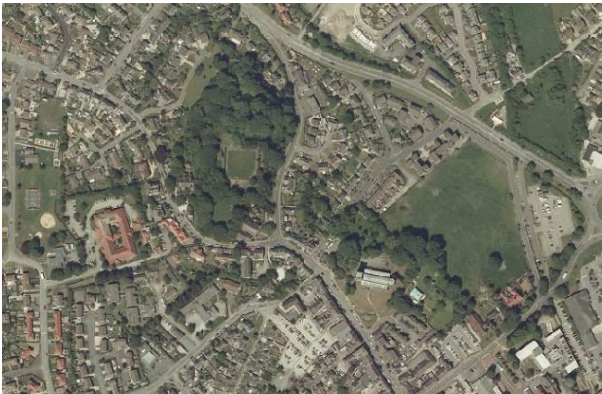
Llun 1. Llun o'r awyr o'r Wyddgrug yn 2009

Roedd astudiaeth o 2016 12 a gyhoeddwyd gan Gyfoeth Naturiol Cymru y edrych ar orchudd coed yn nhrefi a dinasoedd Cymru. Mae gorchudd coed mewn trefi'n cael ei gyfrif fel faint o dir mewn trefi sydd dan orchudd coed neu goetir a gwasgariad y tir hwnnw wrth ei asesu gan ddefnyddio ffotograffau o'r awyr. Yr astudiaeth oedd yr arolwg cenedlaethol cyntaf o'i fath yn y byd a bu iddo ganfod bod cyfartaledd o 16.3% o orchudd coed yng Nghymru yn 2013, a oedd yn is na 17% mewn arolwg blaenorol yn 2009.