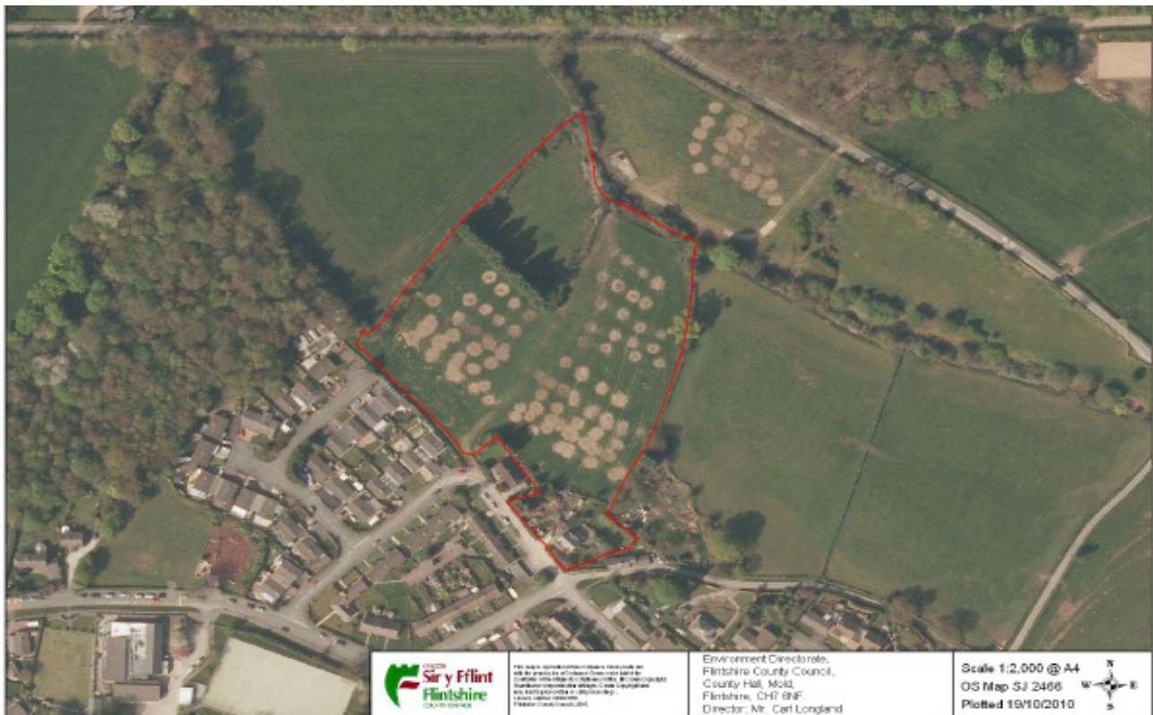
Llun o'r awyr