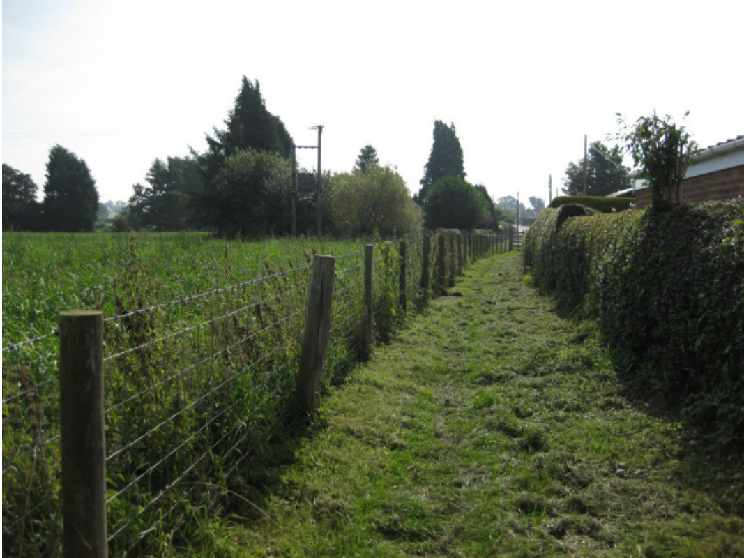
Yr olygfa ar hyd llwybr troed y ffin ddeheuol yn edrych tua'r de ar hyd llinell Clawdd Wat.