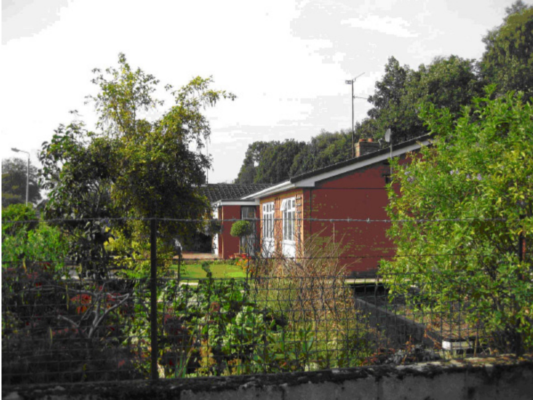
Yr olygfa o'r llwybr troed yn edrych tua'r de-orllewin at Rif 23, Ffordd Celyn.