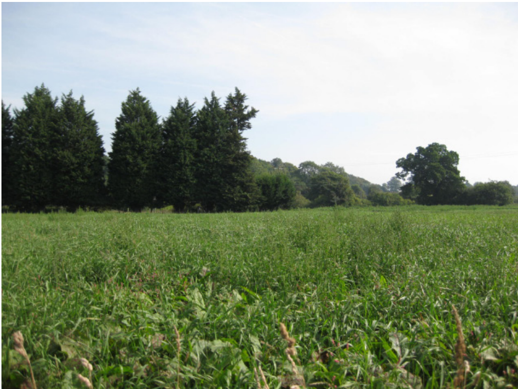
Yr olygfa o'r safle o lwybr troed y ffin ddeheuol yn edrych tua'r gogledd.